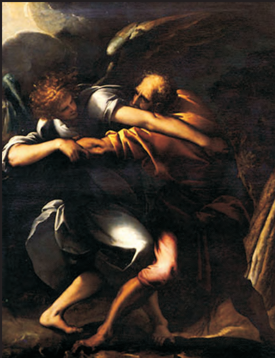
Pier Francesco Mazzucchelli detto il Morazzone Lotta di Giacobbe con l'Angelo olio su tela (1610- 1620) Museo Diocesano, Milano