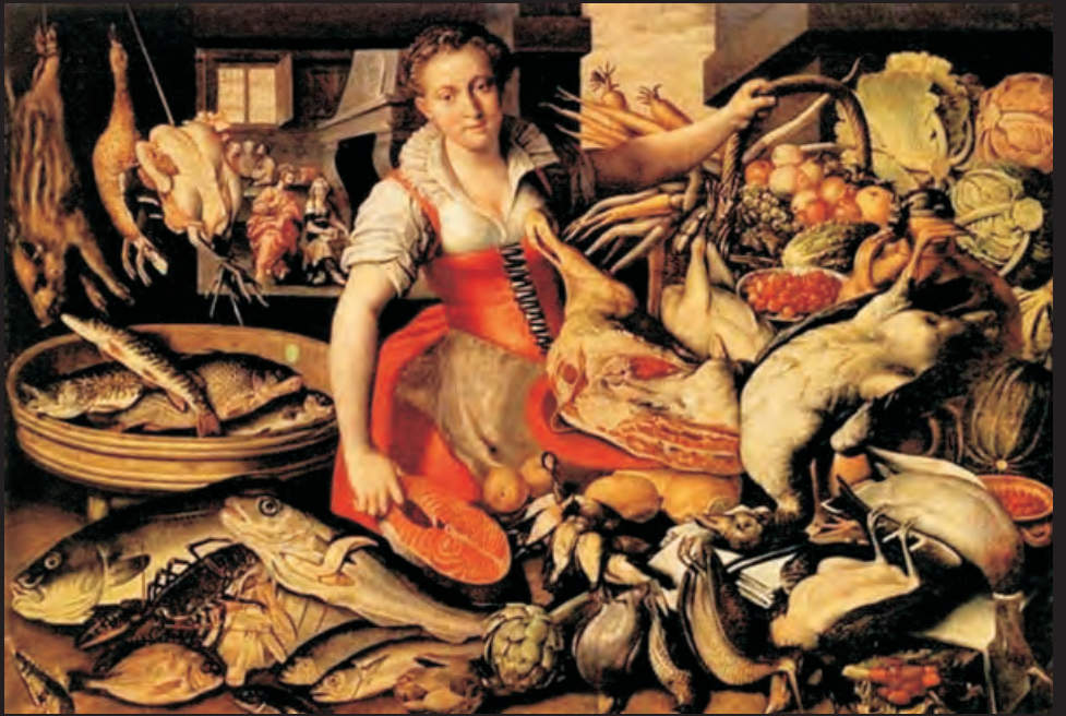
Vincenzo Campi Cristo nella casa di Marta e Maria olio su tela (c. 1580) Galleria Estense, Modena