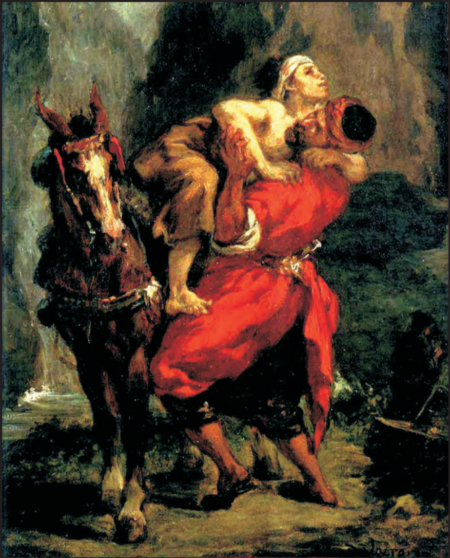
Eugène Delacroix Il buon samaritano olio su tela (1849) collezione privata