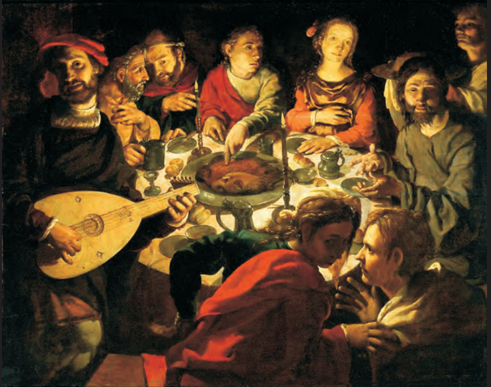
Jan Cornelisz Vermeyen Nozze a Cana olio su tavola (1530) Rijksmuseum, Amsterdam