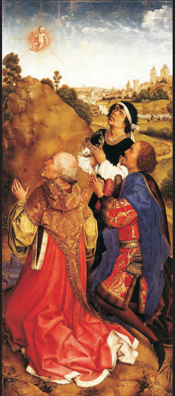
Rogier Van der Weyden La visione dei Magi olio su tavola (c. 1445 - 1448) Gemäldegalerie der Staatlichen Museen, Berlin