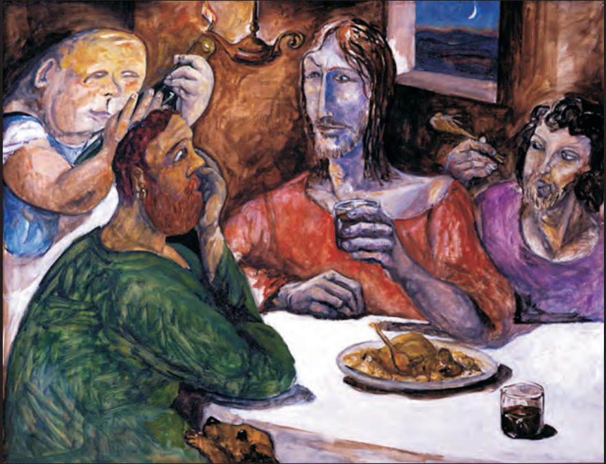
Gerolamo Bolli La cena a Emmaus olio su faesite (1983)