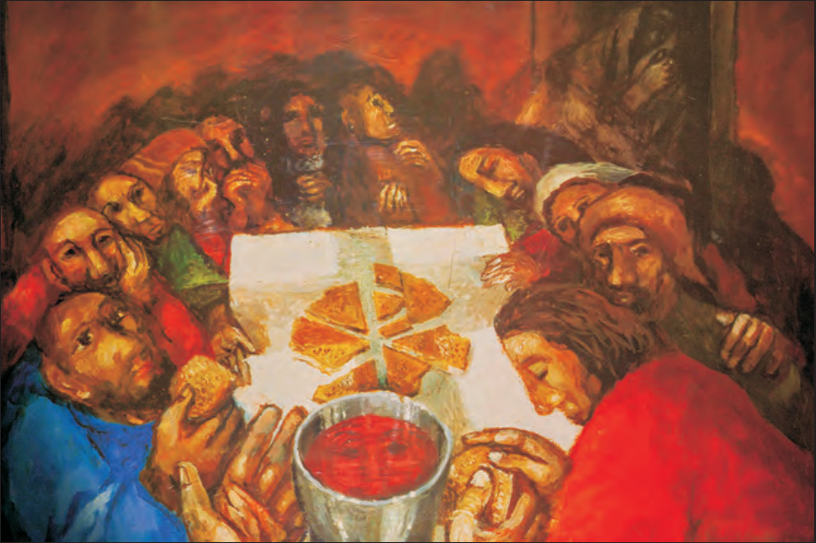
Sieger Köder Ultima Cena